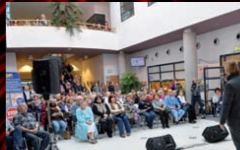
Pacienti i zaměstnanci MOÚ zaplnili vstupní halu Švejda pavilonu.