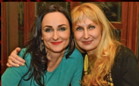
A v Divadelním klubu se mezitím slavila premiéra komedie Jméno.