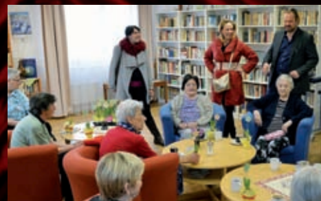
V Modřicích se podívali do Domova pro seniory.