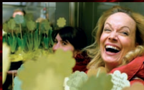
V Rajhradě navštívili Akátový dům.