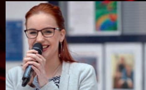
Naši herci se na Žlutý kopec zase brzy vrátí, aby potěšili nemocné i jejich opatrovníky.